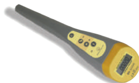
Sonda Gamma Inalámbrica Gamma Finder

La primera sonda gamma inalámbrica/portátil y compacta para la localización de ganglios centinela y glándulas paratiroides en procedimientos de cirugía oncológica y radioguiada.