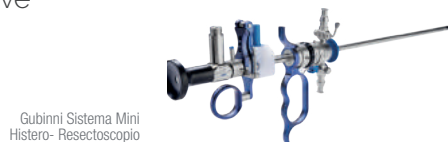
Gubinni Sistema Mini Histero-Resectoscopia