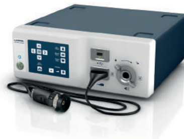
Unidad de Control 3 en 1 con Cámara Full HD