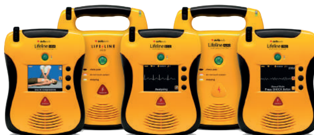
Desfibriladores Externos Automáticos