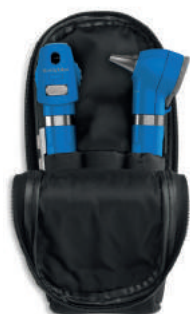
Equipo de Órganos WelchAllyn Pocket LED