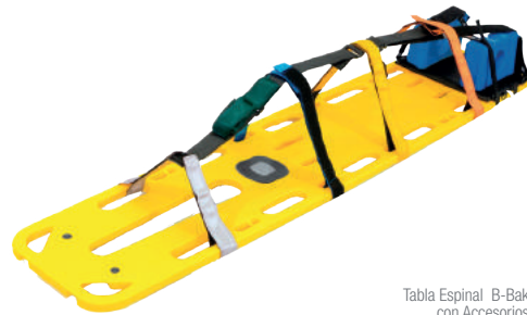
Tabla Espinal B-Bak con Accesorios